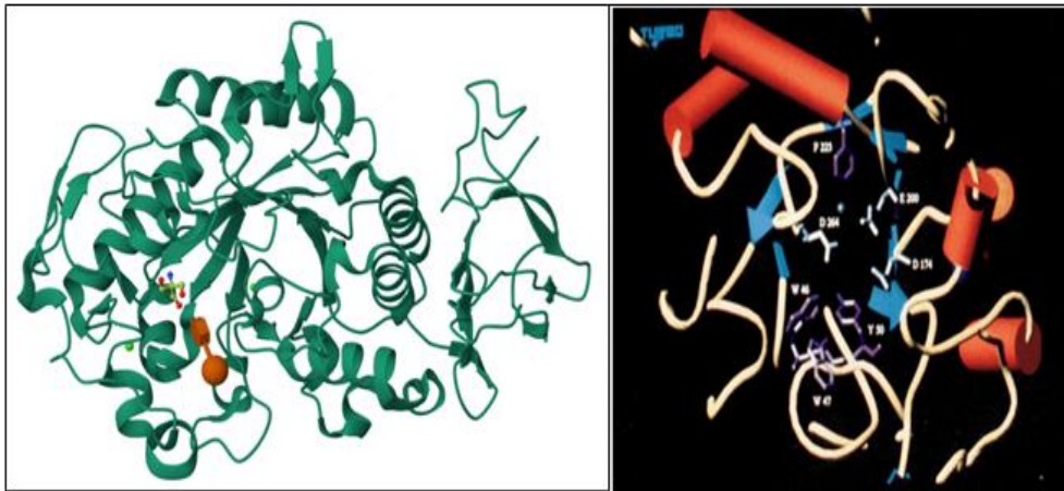
Gambar 1. (a) Struktur \alpha -amilase Pseudoalteromonas haloplanctis, (b) Celah situs aktif \alpha -amilase Pseudoalteromonas haloplanctis terletak di ujung karboksil dari (\beta/\alpha)_8 -bareel. Residu katalitik ditunjukkan dalam warna putih dan residu aromatik yang diperkirakan berperan penting dalam pengikatan substrat dan atau inhibitor ditunjukkan dalam warna ungu [22]

Penelitian pada \alpha -amilase psikrofilik menunjukkan bahwa penambahan kofaktor seperti \text{Ca}^{2+} atau ligand acarbose atau acarviostatin ke larutan protein sering meningkatkan kemungkinan terbentuknya kristal yang memerangkap ligand dalam situs aktif, sehingga memudahkan pemetaan interaksi pengikatan untuk desain aplikasi pangan. Selain itu, karena enzim \alpha -amilase psikrofilik cenderung lebih fleksibel, kondisi kristalisasi pada temperatur rendah dan penyesuaian laju evaporasi dari rasio antara drop dan reservoir menjadi parameter krusial yang dilaporkan berkali-kali dalam literatur kristalografi enzim psikrofilik [29].