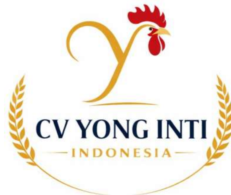
Gambar 4.1 Logo CV Yong Inti Indonesia