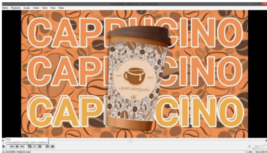
Gambar 7. Animasi Produk 2