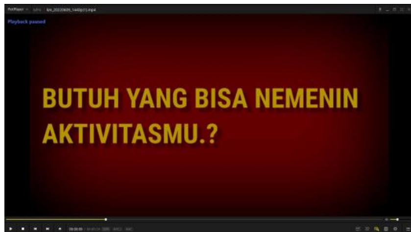
Gambar 4. Transisi Opening Narasi

Gambar 3 menjadi awal pembangunan sebuah storyline dari video promosi Kopi jonggol dengan konsep pertanyaan yang bergantian dimulai dari “Lelah dengan