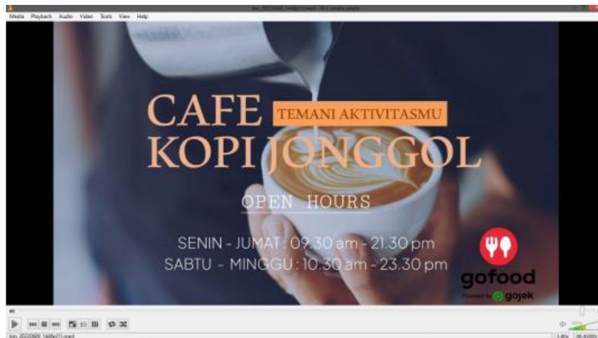
Gambar 10. Tampilan Penutup

Gambar 10 merupakan tampilan pada bagian penutup video yang menampilkan informasi terkait dengan Kopi Jonggol dengan animasi slide motion graphic sederhana.