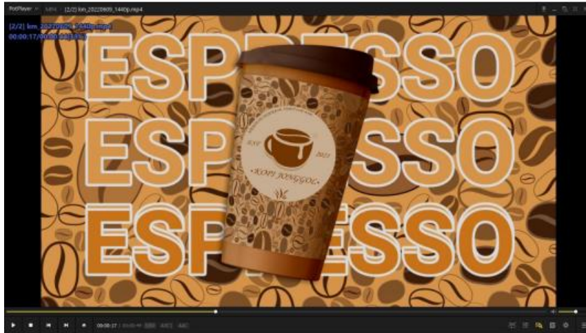
Gambar 6. Animasi Produk 1

konsep animasi teks Kopi Jonggol menjadi background dari mockup kemasan produk dengan animasi teks iklan berjalan seperti yang biasa kita lihat di televisi.