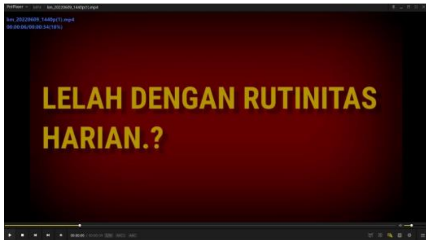
Gambar 3. Opening Narasi