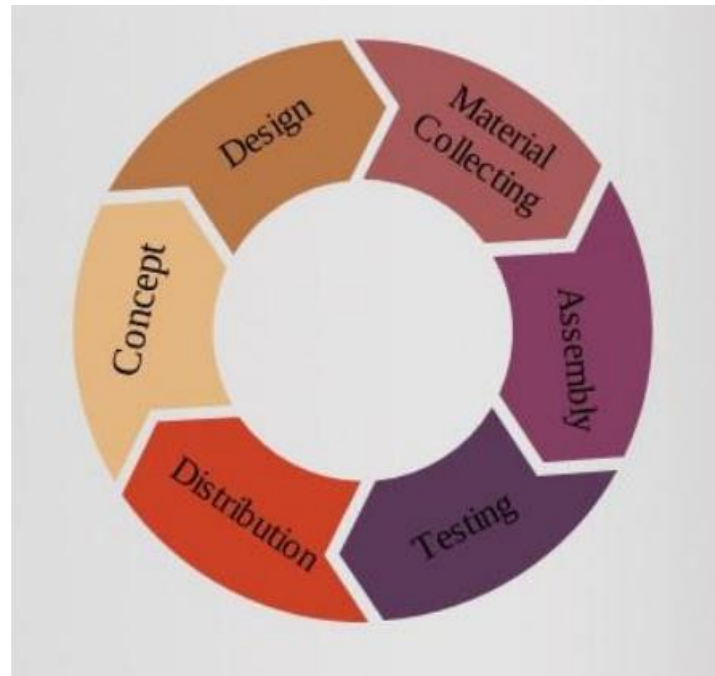
Gambar 1. Multimedia Development Life Cycle

yaitu Concept , Design , Material collecting , Assembly , Testing dan Distribution