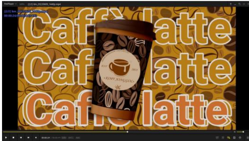
Gambar 8. Animasi Produk 3

Pada gambar diatas menampilkan animasi produk Kopi Jonggol dengan background teks varian menu dari Kopi Jonggol yang