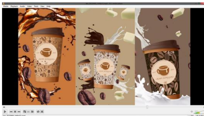
Gambar 9. Animasi Split Screen

berpindah-pindah dan gambar yang juga berubah ubah sesuai dengan produk apa yang di tampilkan