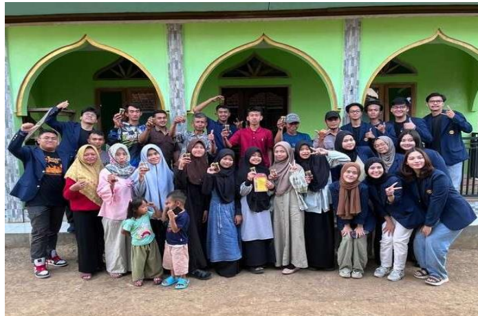
Gambar 5. Foto bersama peserta penyuluhan pengolahan komoditas cabai menjadi produk chili oil untuk peluang UMKM

Penyuluhan pengembangan UMKM berbasis komoditas cabai berhasil memberikan pemahaman kepada masyarakat mengenai produk olahan yang lebih bernilai jual, seperti chili oil . Pelatihan ini diharapkan dapat meningkatkan taraf ekonomi masyarakat dengan memberikan mereka keterampilan dalam pengolahan hasil tani dan pemasaran digital.