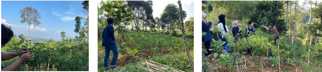
Gambar 2. Kegiatan survei di wilayah kebun cabai di Dusun Sukamulya

turun, tanaman cabai tersebut tak jarang pula dibiarkan begitu saja oleh warga. Hal ini penting diperhatikan guna memperbaiki taraf ekonomi masyarakat Dusun Sukamulya. Oleh karena itu, agar tidak terbuang percuma, diperlukan produk olahan yang berasal dari tanaman cabai untuk meningkatkan nilai jual ( value ) dari komoditas cabai yang ada di Dusun Sukamulya.