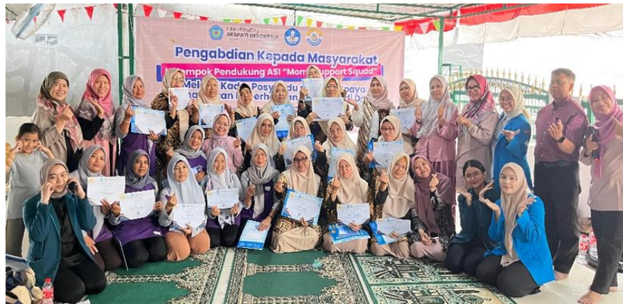
Gambar 1. Dokumentasi Kegiatan Pelatihan Kelompok Pendukung ASI “Moms Support Squad” bersama seluruh tim pengabdian, panitia, mahasiswa dan mitra