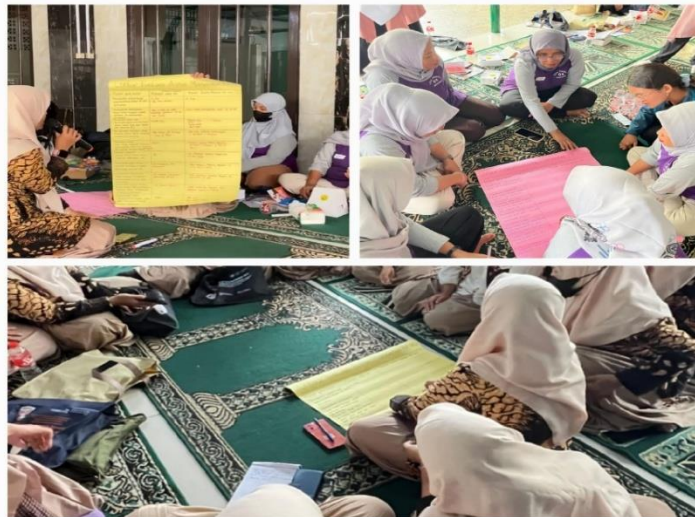
Gambar 3. Focus Group Discussion (FGD) Aspek Manajemen pada Posyandu Anggrek dan Seroja

Setiap kader memiliki logbook guna memudahkan proses pengecekan, pencatatan waktu, aktifitas yang dilakukan kepada ibu menyusui. Dengan adanya logbook , aspek manajemen dapat diaplikasikan dan diharapkan proses pendampingan lebih teratur dan terarah.