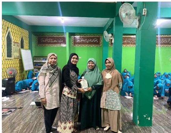
Gambar 1. Penyerahan tanda kerja sama serta kenang-kenangan dari Ketua Panitia kepada Kepala Pondok Khusus Putri Al Halimy, Kabupaten Lombok Barat, Nusa Tenggara Barat

Kegiatan dibuka oleh doa dan kata sambutan kepala pondok dan kemudian dilanjutkan dengan sambutan ketua pelaksana kegiatan pengabdian masyarakat. Tahapan yang dilakukan dalam pelaksanaan kegiatan pengabdian masyarakat ini adalah berturut-turut; pre-test , pemaparan materi, dan post-test . Materi yang disampaikan terdiri dari beberapa topik bahasan secara berurutan antara lain potensi penggunaan kosmetik herbal oleh apt. Neneng Rachmalia Izzatul Mukhlisah, M.Farm., karakteristik kosmetik ilegal oleh apt. Eskarani Tri Pratiwi, M.S.Farm, dan penggunaan kosmetik pada remaja yang disampaikan oleh apt. Sucilawaty Ridwan, M.Sc. Pada kegiatan ini disisipkan materi mengenai pola hidup bersih dan sehat kepada para santri sehingga menunjang kemampuan santriwati merawat diri dan lingkungan dengan baik. Materi ini disampaikan oleh apt. Candra E. Puspitasari, M.Sc.