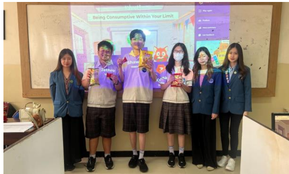
Gambar 5. Pemberian Hadiah kepada Para Pemenang Kahoot!

Sesi ini juga diakhiri dengan permainan Kahoot! dan pemberian hadiah snack kepada tiga pemenang. Pada akhir kegiatan, dilakukan sesi tanya jawab terbuka. Peserta menunjukkan antusiasme tinggi, terlihat dari keaktifan mereka dalam menjawab dan berebut hadiah, bahkan duduk di lantai agar lebih dekat dengan pemateri. Setelah seluruh sesi selesai, dilakukan pertemuan dengan Kepala Sekolah SMP Nation Star Academy untuk mengevaluasi pelaksanaan kegiatan.