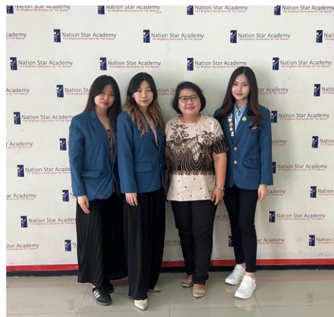
Gambar 6. Foto bersama Kepala Sekolah SMP Nation Star Academy

Seusai kegiatan, pada hari Jumat tanggal 21 Maret angket kepuasan kegiatan pemberdayaan masyarakat bersama mitra diberikan untuk memastikan apakah tujuan edukasi telah tercapai. Pengisian angket kepuasan dilakukan oleh wakil kepala sekolah dan dapat dilihat bahwa wakil kepala sekolah puas dengan edukasi yang dilakukan. Selama pengabdian masyarakat kegiatan edukasi berjalan dengan lancar tanpa kendala yang berarti yang tidak dapat diatasi maka diberikan nilai 4. Terkait materi yang diberikan, oleh pihak NSA dinilai lumayan relevan dan menjawab kebutuhan maka