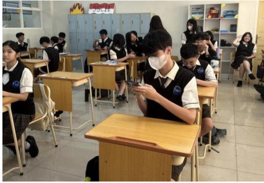
Gambar 3. Sesi Pemberian Materi