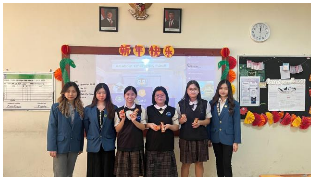
Gambar 4. Pemberian Hadiah kepada Para Pemenang Kahoot!

Materi disampaikan menggunakan PowerPoint berjudul “Emergency Funds” . Sesi ini dilengkapi dengan permainan edukatif menggunakan platform Kahoot! yang berisi kuis seputar dana darurat. Tiga pemenang diberikan hadiah sebagai bentuk apresiasi.