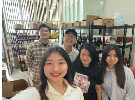
Gbr 2. Pelaksanaan pendampingan pelatihan pertemuan pertama

penggunaan dalam operasi bisnis. Setelah mencapai kesepakatan mahasiswa kemudian membuat template Microsoft Excel.