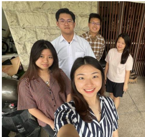
Gbr 1. Kunjungan kantor Green Naturale untuk wawancara

Pendampingan pelatihan meningkatkan kemampuan pemilik UMKM menggunakan Microsoft Excel, yang pada gilirannya mempermudah pengelolaan pencatatan persediaan, pembuatan laporan laba rugi, dan analisis inventory turnover . Dengan memanfaatkan template Microsoft Excel yang dirancang sesuai dengan kebutuhan pemilik dapat dengan mudah mengatasi masalah. Pemilik dapat mencatat persediaan secara real-time , membuat laporan keuangan secara sistematis, dan menganalisa perputaran stok agar dapat membuat keputusan usaha yang tepat. Pendampingan pelatihan mencakup penjelasan fitur dasar Microsoft Excel, pelatihan penggunaan template , dan praktik serta simulasi penggunaan template .