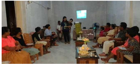
Gambar 8. Simulasi Pemberian Pertolongan Pertama Saat Bencana oleh Tenaga Medis

Setelah selesai melakukan kegiatan sosialisasi, dilakukan post – test terhadap materi yang telah disampaikan. Hasil rerata yang diperoleh yakni 80 dari 30 orang Peserta. Adanya peningkatan hasil test diharapkan dapat mewakili peningkatan pemahaman Masyarakat terhadap materi sosialisasi yang telah diberikan.