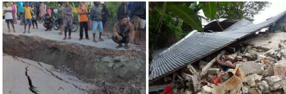
Gambar 2. Dampak Gempa Bumi di Kupang, NTT