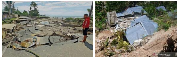
Gambar 1. Dampak Badai Siklon Tropis Seroja Di Kupang, NTT

sedang dan 35.733 unit rumah rusak ringan yang diakibatkan bencana tersebut. Namun khusus pada Daerah Oesapa, Kupang, tercatat memiliki data korban jiwa paling minim meskipun menjadi wilayah dengan posisi di bibir Pantai, oleh karena adanya pemahaman penerimaan pesan tanda – tanda badai dari BMKG yang mampu diterjemahkan dengan baik oleh Masyarakat. Berdasarkan data pada situs resmi BMKG, respon baik dalam upaya mitigasi bencana pada Daerah Oesapa diakibatkan oleh adanya Sekolah Lapang Cuaca Nelayan (SLCN) yang diselenggarakan oleh BMKG, yang pernah diikuti oleh beberapa tokoh di daerah tersebut. Ini menjadi salah satu contoh pentingnya dilakukan mitigasi bencana alam oleh Masyarakat untuk meminimalisir dampak buruk akibat bencana. Meskipun demikian, tidak dapat dipungkiri terdapat sejumlah besar kerusakan konstruksi rumah tinggal maupun fasilitas publik yang diakibatkan pasca terjadinya bencana tersebut. Selain itu, pada tahun yang sama juga terjadi bencana alam yang cukup besar yakni bencana gempa bumi sehingga menyebabkan adanya kerusakan konstruksi bangunan hingga konstruksi jalan. Kerusakan yang dialami dapat diakibatkan oleh adanya kemungkinan kesalahan dalam pembangunan konstruksi itu sendiri maupun oleh adanya kekuatan gempa yang melebihi perkiraan pra pembangunan.