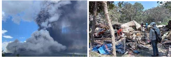
Gambar 4. Fenomena Gunung Lewotobi Meletus di Flores, NTT

Dengan adanya pengalaman yang terjadi berdasarkan beberapa bencana yang dihadapi, Masyarakat diketahui kurang memiliki pemahaman yang baik mengenai resiko hingga cara mitigasi bencana alam tersebut. Beberapa contoh kurangnya pemahaman Masyarakat dapat dilihat dari bidang konstruksi, bidang transportasi dan bidang manajemen biaya.