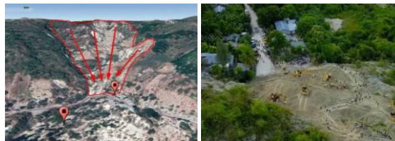
Gambar 3. Fenomena Gunung Berpindah di Kupang, NTT