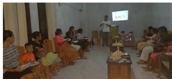
Gambar 7. Penyampaian Materi Sosialisasi

Selain itu, kegiatan ini dilengkapi dengan pemaparan materi dari Tenaga Medis mengenai hal – hal yang harus diperhatikan saat bencana melanda, serta bagaimana pemberian pertolongan pertama bagi Masyarakat yang terdampak bencana (gambar 8).