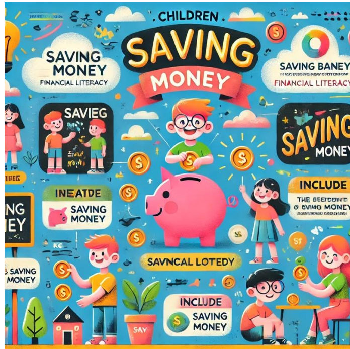
Gambar 1. Poster Interaktif Ajakan Menabung