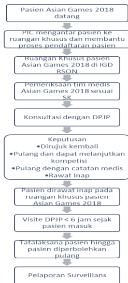
Gambar 2. Alur Pelayanan Pasien Asian Games 2018 pada Rumah Sakit Olahraga Nasional (6)

official subjek lainnya yang berpartisipasi di dalam Asian Games 2018, dilakukan sesuai dengan SOP alur yang telah ditetapkan sebagaimana gambar 2 berikut ini: