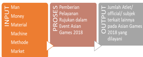
Gambar 1. Pendekatan Sistem Input-Proses-Output dalam Pemberian Pelayanan RSON sebagai Rumah Sakit Rujukan Asian Games 2018

Adapun pendekatan model sistem yang digunakan oleh RSON saat menjadi rumah sakit rujukan Asian Games 2018 yaitu: