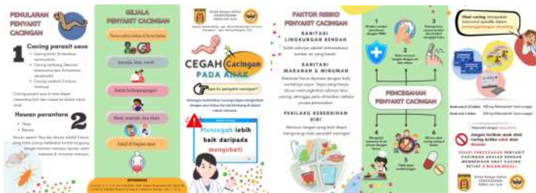
Gambar 1. Media Leaflet

Sasaran dari kegiatan promosi kesehatan dengan judul “Cegah Penyakit Cacingan pada Anak” adalah masyarakat (khususnya ibu-ibu) di Posyandu Balita Kartika Puskesmas Sungai Ulin. Promosi kesehatan dilakukan menggunakan media leaflet (Gambar 1) dan X-banner (Gambar 2) yang dibagikan kepada masyarakat dan memaparkan isi dari media tersebut dengan metode ceramah secara langsung di hadapan masyarakat. Evaluasi pengetahuan masyarakat tentang penyakit cacingan dengan cara kuisisioner. Pengukuran pengetahuan tentang cegah penyakit cacingan pada anak melalui kuisisioner dilakukan sebelum edukasi/pemaparan materi dan sesudah edukasi/pemaparan materi di akhir kegiatan.