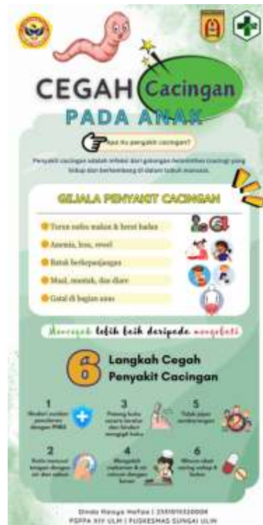
Gambar 2. Media X-Banner