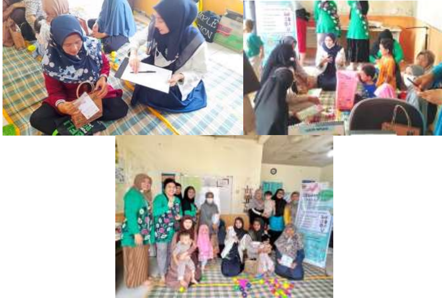
Gambar 3. Foto Kegiatan

yang dilakukan pada masyarakat dengan soal yang sama. Hasil pengukuran dengan kuesioner diperoleh persentase pengetahuan tentang penyakit cacingan pada masyarakat Posyandu Balita Kartika Puskesmas Sungai Ulin meningkat sebesar 22,66%. Dimana pengetahuan sebelum edukasi sebesar 74,67% menjadi 97,33% sesudah edukasi. Hasil promosi kesehatan yang telah dilaksanakan sejalan dengan pengabdian lainnya dimana terjadi peningkatan pengetahuan (Achyadi et al. , 2024).